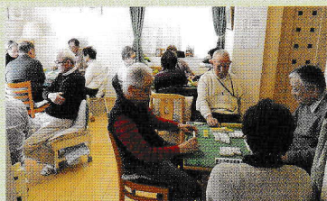
まちづくり活動基金 (地域共生のいえ「ななこの積み木ハウス」)