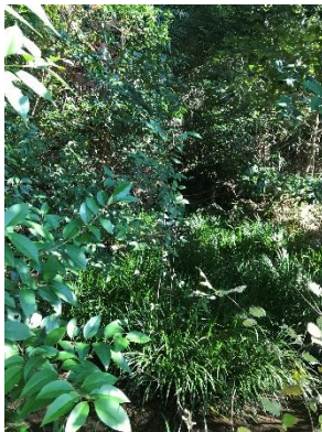
世田谷通りすぐ横 こんなところに湧水が!!

10:45~11:00 大蔵3丁目公園 (大蔵団地世田谷通り) から大蔵運動公園下