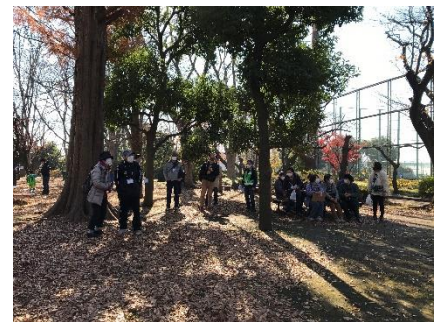
11:20 大蔵運動公園にて2度目の休憩 ここまで坂を登りきりました