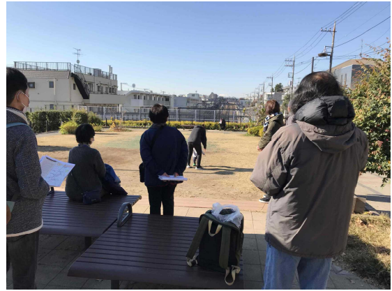
世田谷代田356公園より富士山を望む