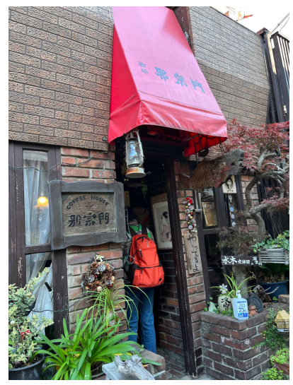
森茉莉が愛した喫茶邪宗門