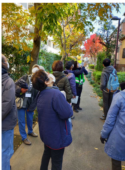
北沢川緑道を楽しむ