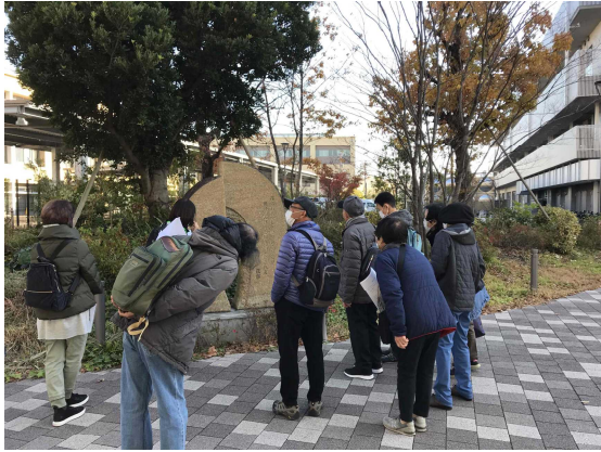
うめとびあ斎藤茂吉歌碑からスタート