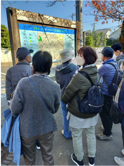
円乗寺／六地藏 園内散策