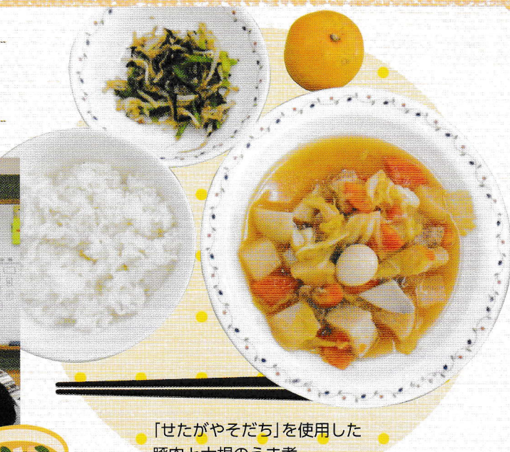
「せたがやそだち」を使用した 豚肉と大根のうま煮

子どもたちは「今日の大根は甘くてやわらかかった」「とても美味しく残さず食べられた」等、楽しそうに農家の方と談笑していました。