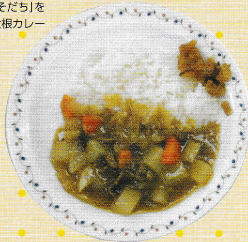
「せたがやそだち」を 使用した大根カレー