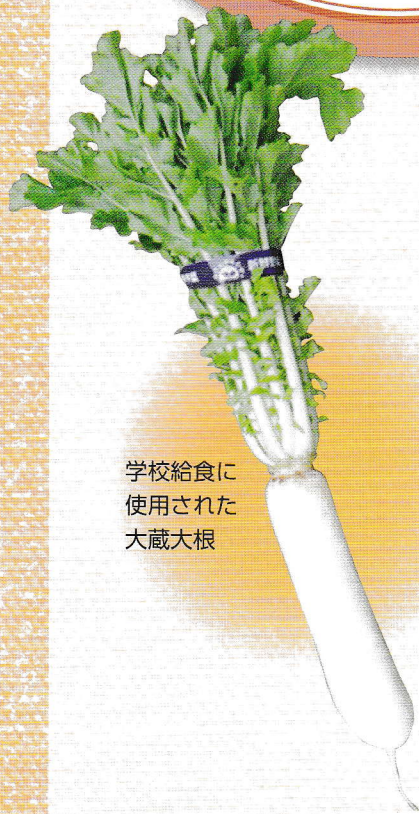
学校給食に 使用された 大蔵大根