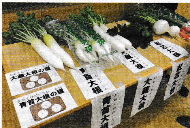
子どもたちへの授業用に収穫し、使用された野菜